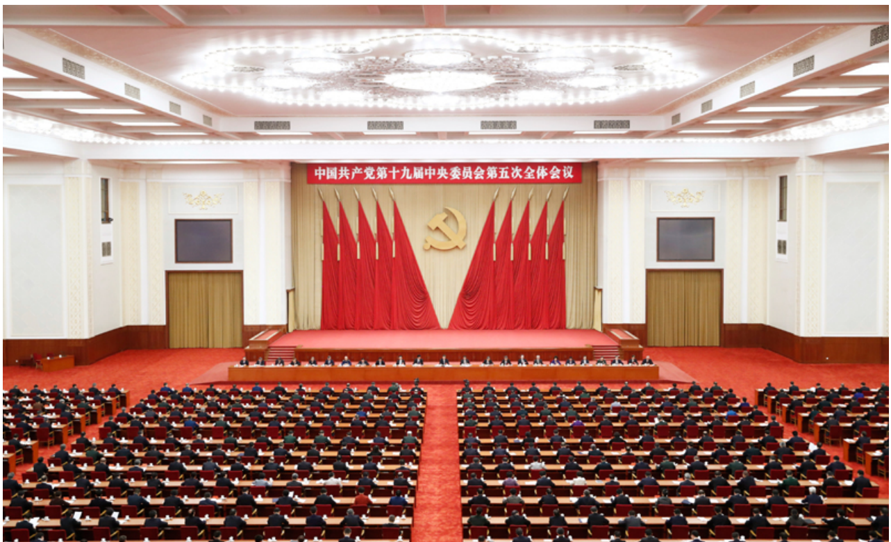
中国共产党第十九届中央委员会第五次全体会议，于2020年10月26日至29日在北京举行。

全会提出，加快国防和军队现代化，实现富国和强军相统一。贯彻习近平强军思想，贯彻新时代军事战略方针，坚持党对人民军队的绝对领导，坚持政治建军、改革强军、科技强军、人才强军、依法治军，加快机械化信息化智能化融合发展，全面加强练兵备战，提高捍卫国家主权、安全、发展利益的战略能力，确保二〇二七年实现建军百年奋斗目标。要提高国防和军队现代化质量效益，促进国防实力和经济实力同步提升，构建一体化国家战略体系和能力，推动重点区域、重点领域、新兴领域协调发展，优化国防科技工业布局，巩固军政军民团结。