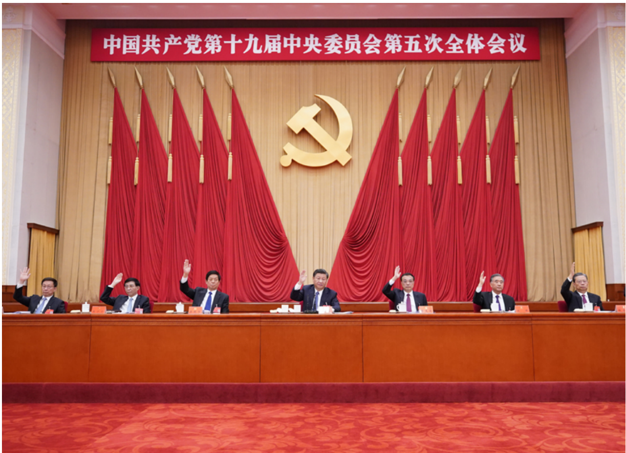
中国共产党第十九届中央委员会第五次全体会议，于2020年10月26日至29日在北京举行。这是习近平、李克强、栗战书、汪洋、王沪宁、赵乐际、韩正等在主席台上。

全会高度评价决胜全面建成小康社会取得的决定性成就。“十三五”时期，全面深化改革取得重大突破，全面依法治国取得重大进展，全面从严治党取得重大成果，国家治理体系和治理能力现代化加快推进，中国共产党领导和我国社会主义制度优势进一步彰显；经济实力、科技实力、综合国力跃上新的大台阶，经济运行总体平稳，经济结构持续优化，预计二〇二〇年国内生产总值突破一百万亿元；脱贫攻坚成果举世瞩目，五千五百七十五万农村贫困人口实现脱贫；粮食年产量连续五年稳定在一万三千亿斤以上；污染防治力度加大，生态环境明显改善；对外开放持续扩大，共建“一带一路”成果丰硕；人民生活水平显著提高，高等教育进入普及化阶段，城镇新增就业超过六千万人，建成世界上规模最大的社会保障体系，基本医疗保险覆盖超过十三亿人，基本养老保险覆盖近十亿人，新冠肺炎疫情防控取得重大战略成果；文化事业和文化产业繁荣发展；国防和军队建设水平大幅提升，军队组织形态实现重大变革；国家安全全面加强，社会保持和谐稳定。“十三五”规划目标任务即将完成，全面建成小康社会胜利在望，中华民族伟大复兴向前迈出了新的一大步，社会主义中国以更加雄伟的身姿屹立于世界东方。