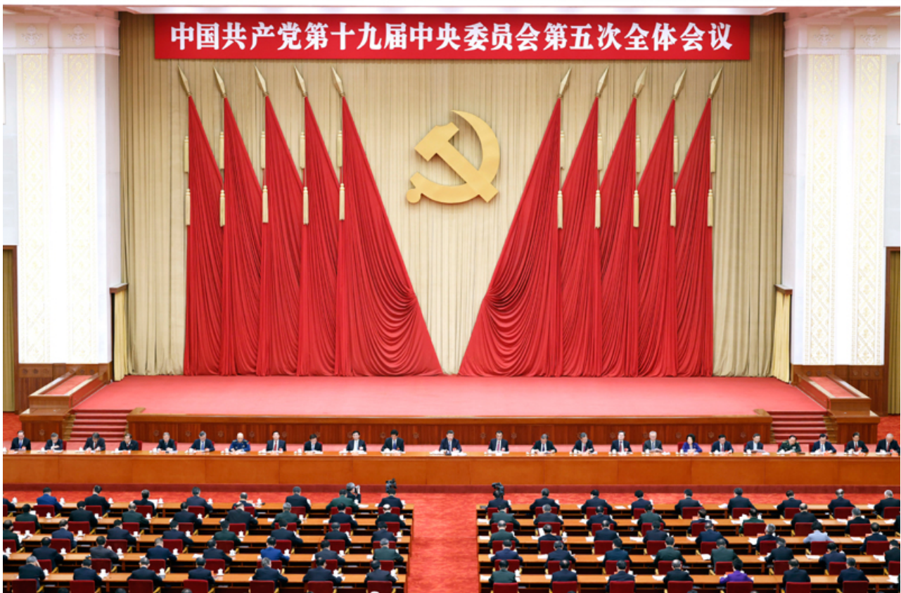
中国共产党第十九届中央委员会第五次全体会议，于2020年10月26日至29日在北京举行。

全会深入分析了我国发展环境面临的深刻复杂变化，认为当前和今后一个时期，我国发展仍然处于重要战略机遇期，但机遇和挑战都有新的发展变化。当今世界正经历百年未有之大变局，新一轮科技革命和产业变革深入发展，国际力量对比深刻调整，和平与发展仍然是时代主题，人类命运共同体理念深入人心，同时国际环境日趋复杂，不稳定性不确定性明显增加。我国已转向高质量发展阶段，制度优势显著，治理效能提升，经济长期向好，物质基础雄厚，人力资源丰富，市场空间广阔，发展韧性强劲，社会大局稳定，继续发展具有多方面优势和条件，同时我国发展不平衡不充分问题仍然突出，重点领域关键环节改革任务仍然艰巨，创新能力不适应高质量发展要求，农业基础还不稳固，城乡区域发展和收入分配差距较大，生态环保任重道远，民生保障存在短板，社会治理还有弱项。全党要统筹中华民族伟大复兴战略全局和世界百年未有之大变局，深刻认识我国社会主要矛盾变化带来的新特征新要求，深刻认识错综复杂的国际环境带来的新矛盾新挑战，增强机遇意识和风险意识，立足社会主义初级阶段基本国情，保持战略定力，办好自己的事，认识和把握发展规律，发扬斗争精神，树立底线思维，准确识变、科学应变、主动求变，善于在危机中育先机、于变局中开新局，抓住机遇，应对挑战，趋利避害，奋勇前进。