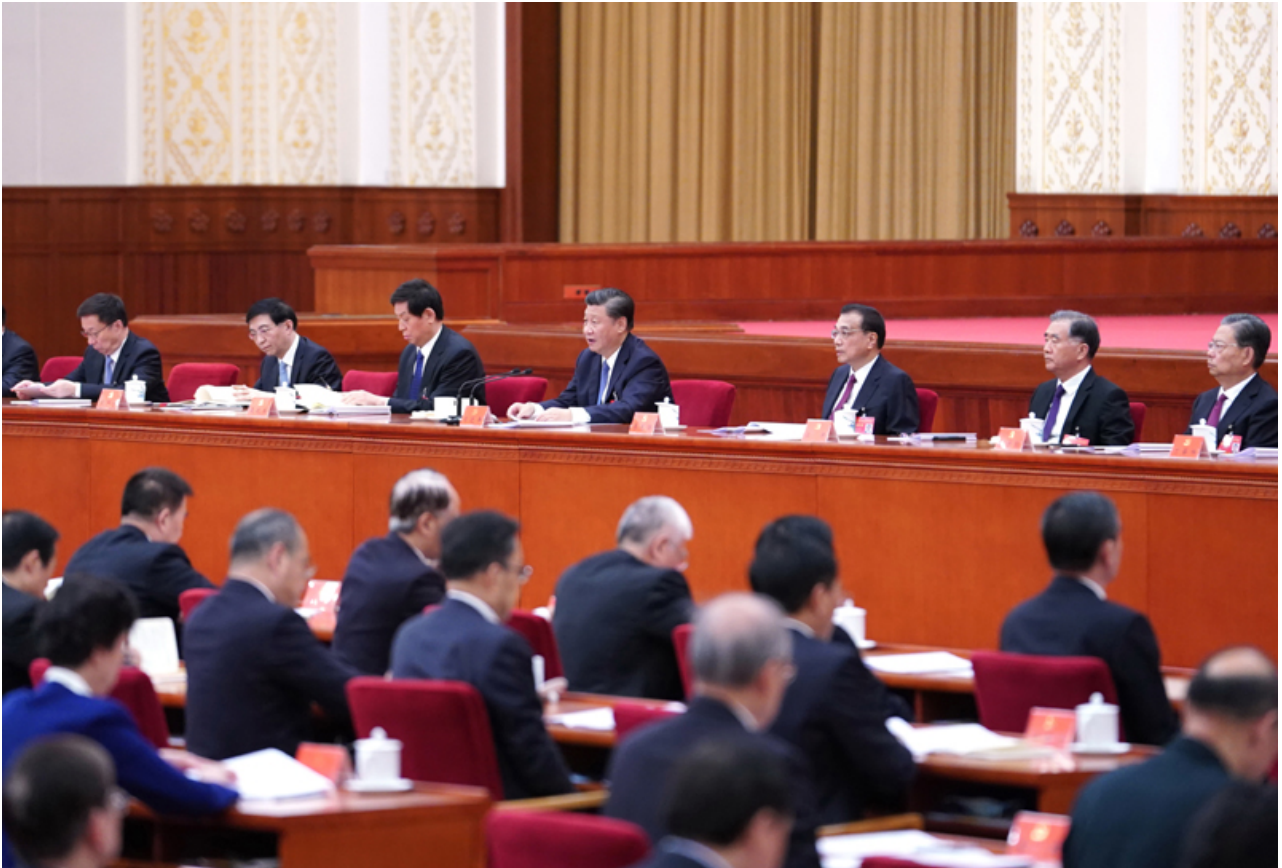
中国共产党第十九届中央委员会第五次全体会议，于2020年10月26日至29日在北京举行。这是习近平、李克强、栗战书、汪洋、王沪宁、赵乐际、韩正等在主席台上。

居民收入增长和经济增长基本同步，分配结构明显改善，基本公共服务均等化水平明显提高，全民受教育程度不断提升，多层次社会保障体系更加健全，卫生健康体系更加完善，脱贫攻坚成果巩固拓展，乡村振兴战略全面推进；国家治理效能得到新提升，社会主义民主法治更加健全，社会公平正义进一步彰显，国家行政体系更加完善，政府作用更好发挥，行政效率和公信力显著提升，社会治理特别是基层治理水平明显提高，防范化解重大风险体制机制不断健全，突发公共事件应急能力显著增强，自然灾害防御水平明显提高，发展安全保障更加有力，国防和军队现代化迈出重大步伐。