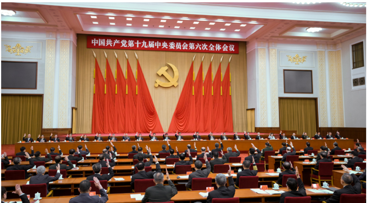
中国共产党第十九届中央委员会第六次全体会议，于2021年11月8日至11日在北京举行。中央政治局主持会议。

全会指出了中国共产党百年奋斗的历史意义：党的百年奋斗从根本上改变了中国人民的前途命运，中国人民彻底摆脱了被欺负、被压迫、被奴役的命运，成为国家、社会和自己命运的主人，中国人民对美好生活的向往不断变为现实；党的百年奋斗开辟了实现中华民族伟大复兴的正确道路，中国仅用几十年时间就走完发达国家几百年走过的工业化历程，创造了经济快速发展和社会长期稳定两大奇迹；党的百年奋斗展示了马克思主义的强大生命力，马克思主义的科学性和真理性在中国得到充分检验，马克思主义的人民性和实践性在中国得到充分贯彻，马克思主义的开放性和时代性在中国得到充分彰显；党的百年奋斗深刻影响了世界历史进程，党领导人民成功走出中国式现代化道路，创造了人类文明新形态，拓展了发展中国家走向现代化的途径；党的百年奋斗锻造了走在时代前列的中国共产党，形成了以伟大建党精神为源头的精神谱系，保持了党的先进性和纯洁性，党的执政能力和领导水平不断提高，中国共产党无愧为伟大光荣正确的党。