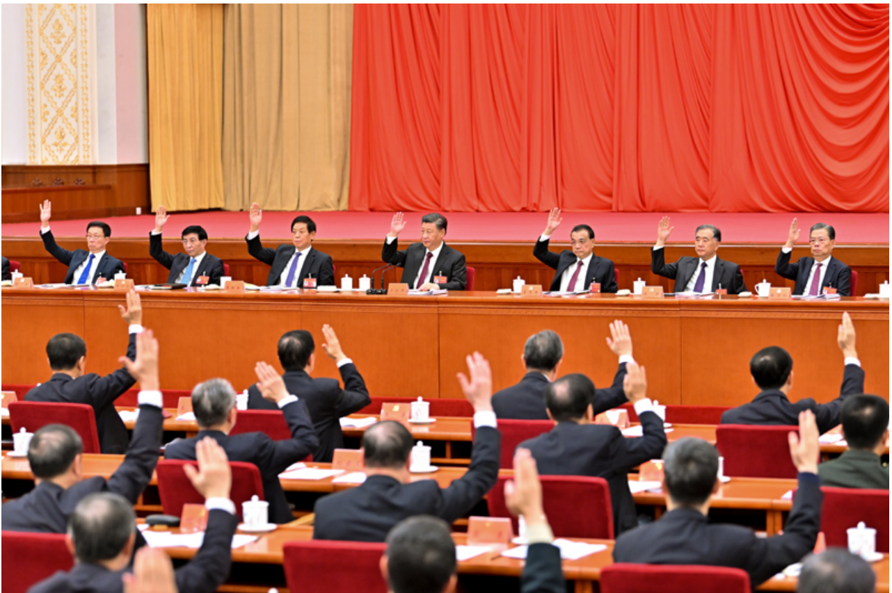
中国共产党第十九届中央委员会第六次全体会议，于2021年11月8日至11日在北京举行。这是习近平、李克强、栗战书、汪洋、王沪宁、赵乐际、韩正等在主席台上。

法治中国建设迈出坚实步伐，党运用法治方式领导和治理国家的能力显著增强。在文化建设上，我国意识形态领域形势发生全局性、根本性转变，全党全国各族人民文化自信明显增强，全社会凝聚力和向心力极大提升，为新时代开创党和国家事业新局面提供了坚强思想保证和强大精神力量。在社会建设上，人民生活全方位改善，社会治理社会化、法治化、智能化、专业化水平大幅度提升，发展了人民安居乐业、社会安定有序的良好局面，续写了社会长期稳定奇迹。在生态文明建设上，党中央以前所未有的力度抓生态文明建设，美丽中国建设迈出重大步伐，我国生态环境保护发生历史性、转折性、全局性变化。在国防和军队建设上，人民军队实现整体性革命性重塑、重整行装再出发，国防实力和经济实力同步提升，人民军队坚决履行新时代使命任务，以顽强斗争精神和实际行动捍卫了国家主权、安全、发展利益。在维护国家安全上，国家安全得到全面加强，经受住了来自政治、经济、意识形态、自然界等方面的风险挑战考验，为党和国家兴旺发达、长治久安提供了有力保证。在坚持“一国两制”和推进祖国统一上，党中央采取一系列标本兼治的举措，坚定落实“爱国者治港”、“爱国者治澳”，推动香港局势实现由乱到治的重大转折，为推进依法治港治澳、促进“一国两制”实践行稳致远打下了坚实基础；坚持一个中国原则和“九二共识”，坚决反对“台独”分裂行径，坚决反对外部势力干涉，牢牢把握两岸关系主导权和主动权。在外交工作上，中国特色大国外交全面推进，构建人类命运共同体成为引领时代潮流和人类前进方向的鲜明旗帜，我国外交在世界大变局中开创新局、在世界乱局中化危为机，我国国际影响力、感召力、塑造力显著提升。中国共产党和中国人民以英勇顽强的奋斗向世界庄严宣告，中华民族迎来了从站起来、富起来到强起来的伟大飞跃。