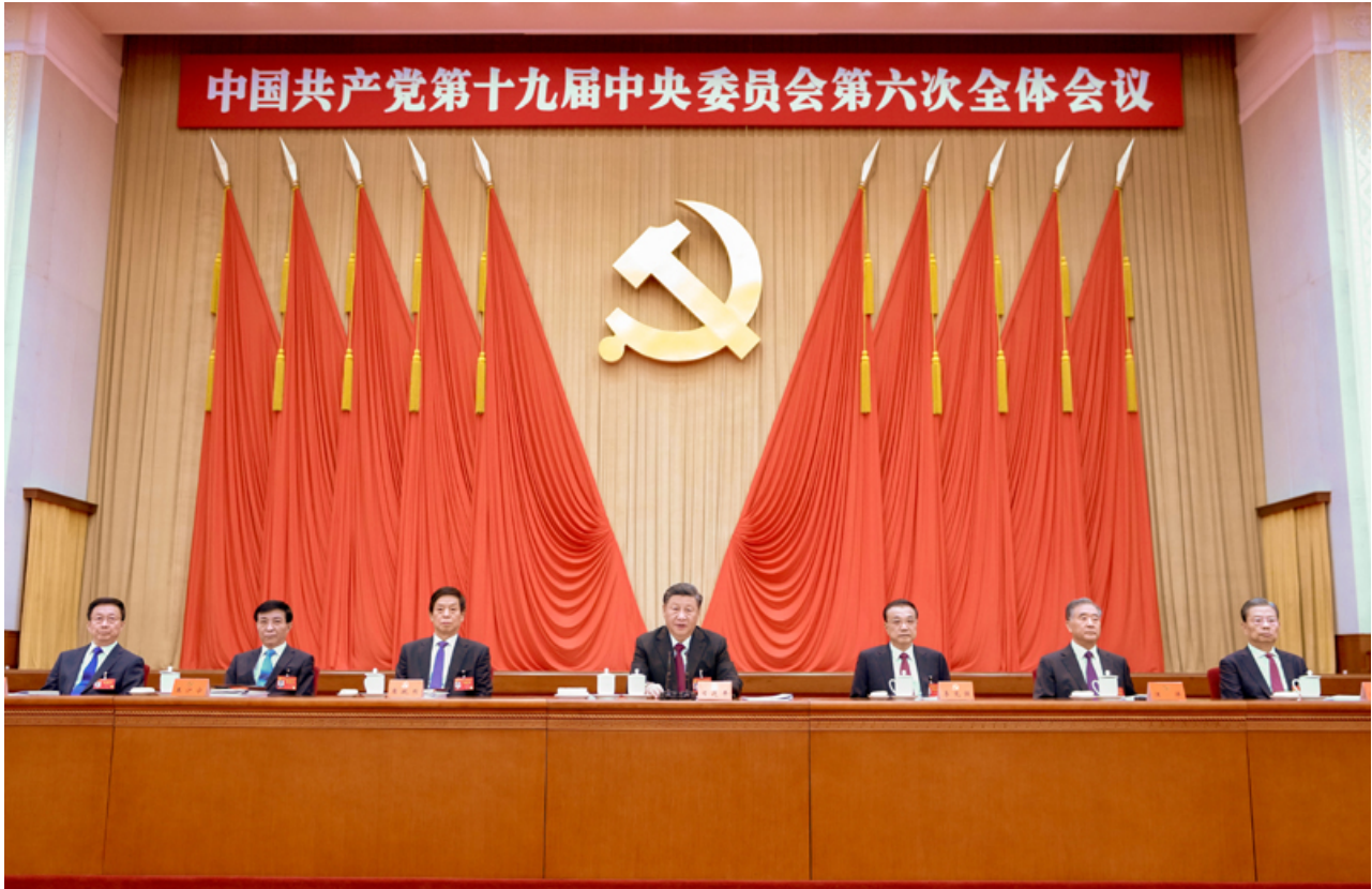
中国共产党第十九届中央委员会第六次全体会议，于2021年11月8日至11日在北京举行。这是习近平、李克强、栗战书、汪洋、王沪宁、赵乐际、韩正等在主席台上。

全会认为，总结党的百年奋斗重大成就和历史经验，是在建党百年历史条件下开启全面建设社会主义现代化国家新征程、在新时代坚持和发展中国特色社会主义的需要；是增强政治意识、大局意识、核心意识、看齐意识，坚定道路自信、理论自信、制度自信、文化自信，做到坚决维护习近平同志党中央的核心、全党的核心地位，坚决维护党中央权威和集中统一领导，确保全党步调一致向前进的需要；是推进党的自我革命、提高全党斗争本领和应对风险挑战能力、永葆党的生机活力、团结带领全国各族人民为实现中华民族伟大复兴的中国梦而继续奋斗的需要。全党要坚持唯物史观和正确党史观，从党的百年奋斗中看清楚过去我们为什么能够成功、弄明白未来我们怎样才能继续成功，从而更加坚定、更加自觉地践行初心使命，在新时代更好坚持和发展中国特色社会主义。