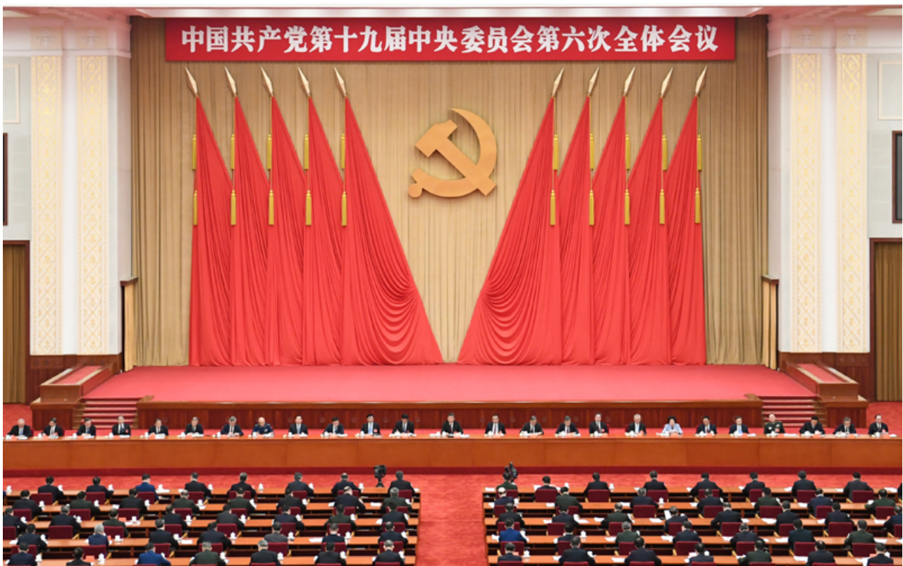
中国共产党第十九届中央委员会第六次全体会议，于2021年11月8日至11日在北京举行。新华社记者 翟健岚 摄

全会强调，在这个时期，党从新的实践和时代特征出发坚持和发展马克思主义，科学回答了建设中国特色社会主义的发展道路、发展阶段、根本任务、发展动力、发展战略、政治保证、祖国统一、外交和国际战略、领导力量和依靠力量等一系列基本问题，形成中国特色社会主义理论体系，实现了马克思主义中国化新的飞跃。党领导人民解放思想、锐意进取，创造了改革开放和社会主义现代化建设的伟大成就，我国实现了从高度集中的计划经济体制到充满活力的社会主义市场经济体制、从封闭半封闭到全方位开放的历史性转变，实现了从生产力相对落后的状况到经济总量跃居世界第二的历史性突破，实现了人民生活从温饱不足到总体小康、奔向全面小康的历史性跨越，推进了中华民族从站起来到富起来的伟大飞跃。中国共产党和中国人民以英勇顽强的奋斗向世界庄严宣告，改革开放是决定当代中国前途命运的关键一招，中国特色社会主义道路是指引中国发展繁荣的正确道路，中国大踏步赶上了时代。